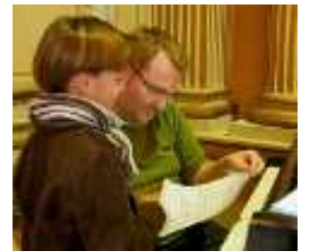
Le Grand Théâtre recrute un chœur d'enfants.