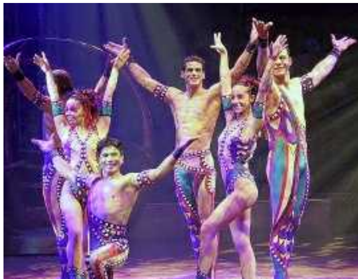
Une troupe exceptionnelle pour en mettre plein les yeux.

Cette année, le Festival international de cirque de Tours participera aux célébrations des 150 ans du trapèze volant